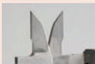
Губки с твердосплавными измерительными поверхностями