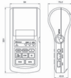
Размеры в мм