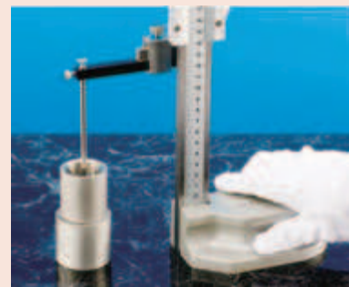
Наконечник для измерения глубины