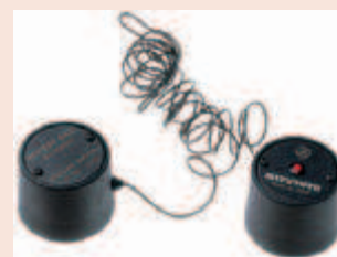
Электрический контактный датчик 900872