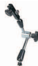
011362 Механический зажим Размеры : см. 011358