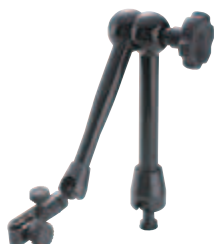
56AAK793 Механический зажим Размеры: см. 7033B