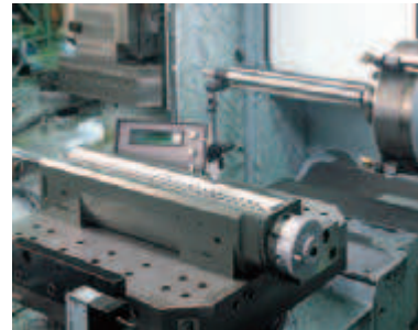
Использовать в горизонтальном положении