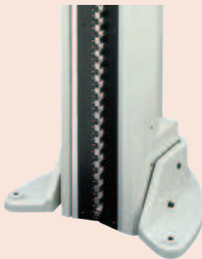
900574 (дополнительно) Опорное основание для вертикальной установки