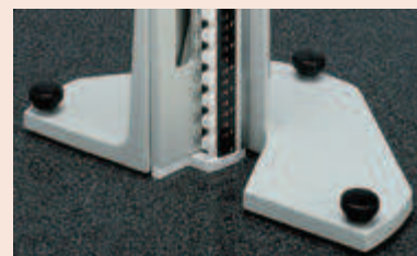
601167 (опция) Опорное основание для вертикальной установки