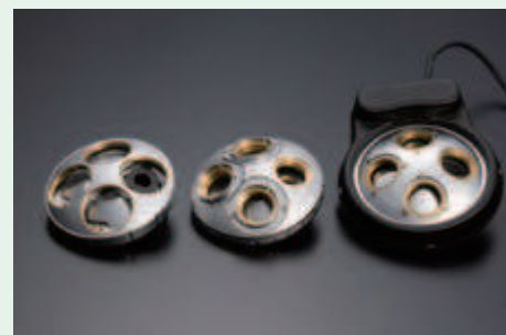
Ручная и моторизованная револьверные головки