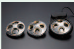
Оptionальные револьверные головки (Необходимая опция для MF-UD)