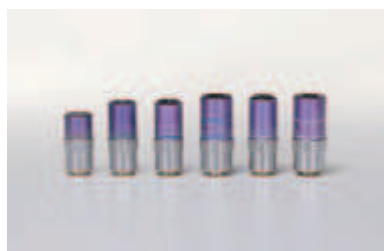
Объективы M Plan Apo NUV с коррекцией в ближней ультрафиолетовой области спектра