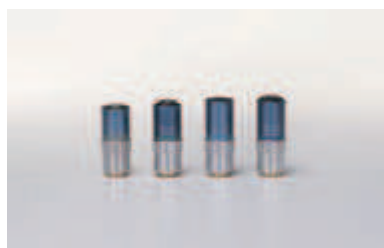
Объективы M Plan UV с коррекцией в ультрафиолетовой области спектра