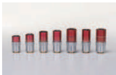
Объективы M Plan Apo NIR с коррекцией в ближней инфракрасной области спектра