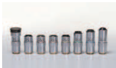
M Plan Apo и M Plan Apo SL Объективы для наблюдения в светлом поле

Объективы серии 378 компании Mitutoyo имеют рабочее расстояние, которое является одним из самых больших в мире, а также оптическую систему с корректировкой на бесконечности. Эти объективы обеспечивают гибкость наблюдения обзор при большом увеличении и независимую коррекцию хроматической аберрации.