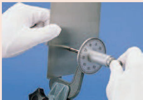
Серия 119 оснащается циферблатом для удобного и быстрого считывания.