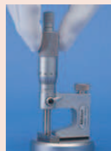
950758 с микрометром