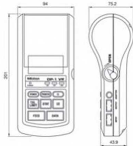
Размеры в мм