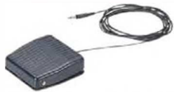
Педальный переключатель - 937179T