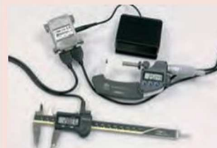
Пример применения с педальным переключателем (дополнительные принадлежности)