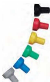
Цветные трещоточные колпачки