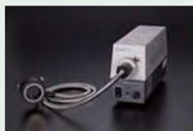
Кольцевая оптоволоконная подсветка