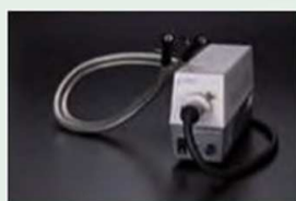
Двойной S-образный световод