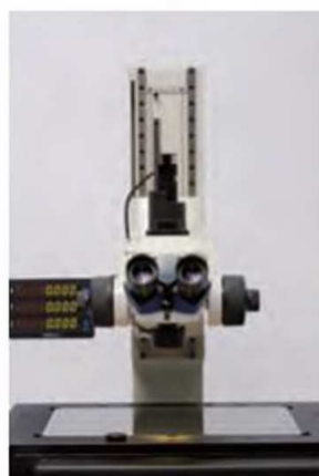
Оптоволоконная кольцевая подсветка