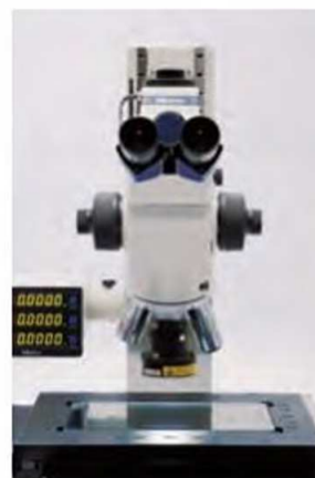
Кольцевая светодиодная подсветка (для линз объективов FS)

Осветительный прибор с двойным S-образным световодом