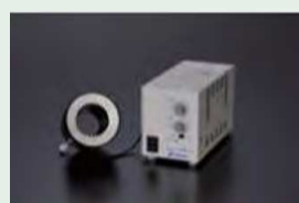
Кольцевая светодиодная подсветка