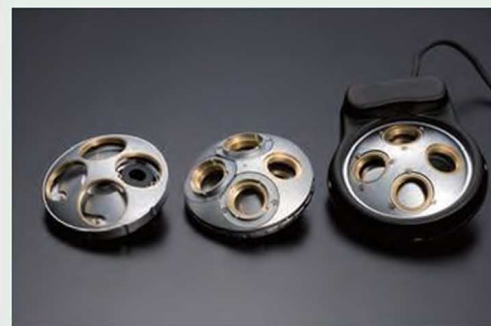
Ручная и моторизованная револьверные головки