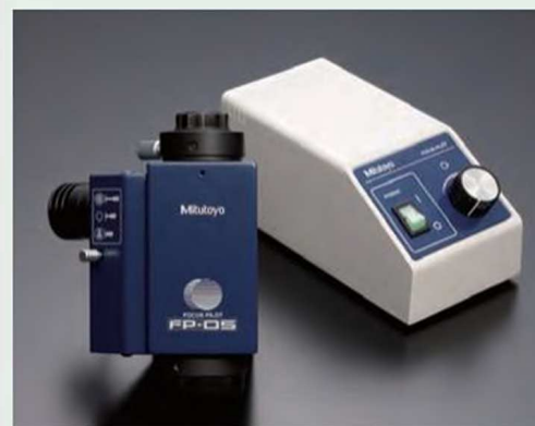
Управление фокусом опционально устанавливается на заводе