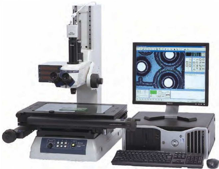
ПК, программное обеспечение QSPAK VUE и микроскоп - опциональны.

Графическое окно. Результаты измерений и сами измеряемые элементы отображаются в графическом окне в режиме реального времени. Используя эту функцию, пользователь сразу может проверять текущее положение измерения. Графическое окно может быть использовано для геометрических расчетов.