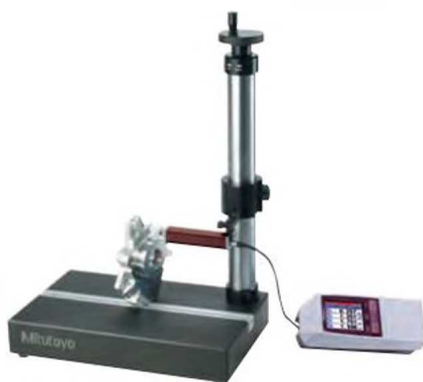
178-029 (на фото с SJ-210)