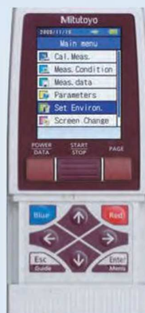
Защитная крышка клавиатуры открыта