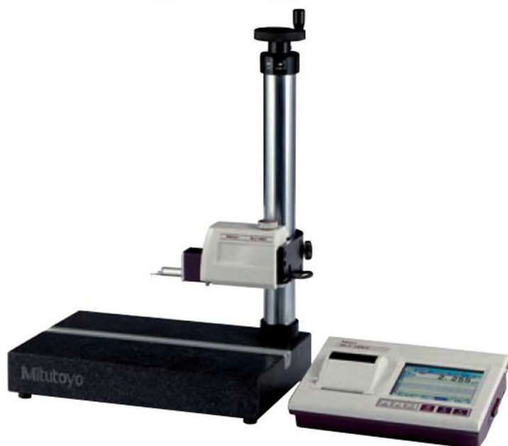
178-039 (на фото с SJ-411)