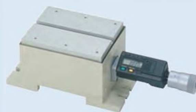
178-048 Нивелировочный стол D.A.T.