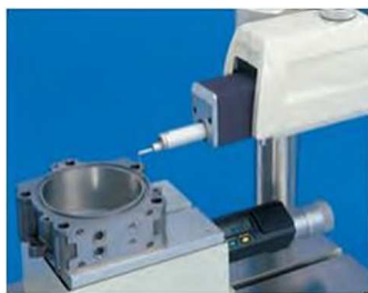
Измерение глубоких канавок