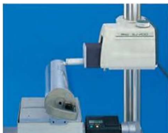
Измерение радиусной поверхности