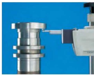
Измерение в перевернутом положении