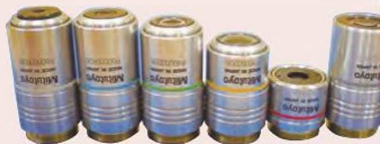
Широкий ассортимент объективов, доступных для различных увеличений