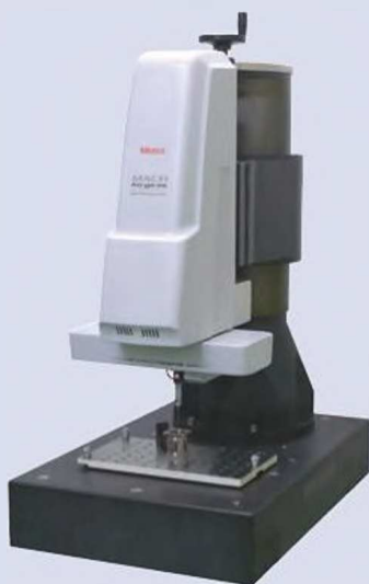
MACH Ko-ga-me 12128-3V с дополнительным стендом