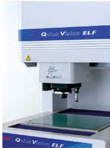
Quick Vision-ELF с контактным датчиком

Подробности см. в документации на Quick Vision