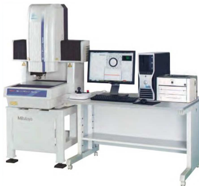
ВИМ Quick Vision-APEX с опциональным контактным датчиком