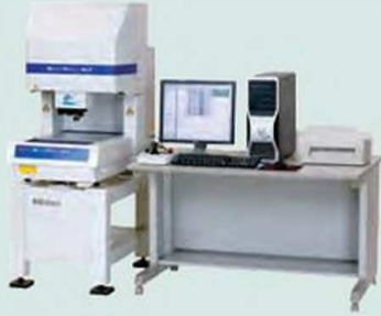
Модели Quick Vision-ELF