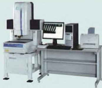
Модели QV-APEX и HYPER