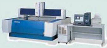
Модели Quick Vision Accel