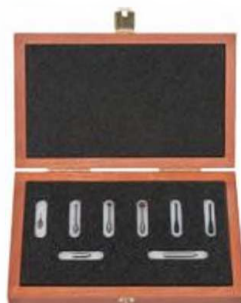
Набор щупов M2 Стандартный

Компактный и высокоточный тип головки со сменными щупами