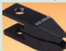
Губки для \varnothing 1-3