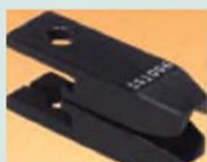
Губки для \varnothing 4-5