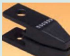
Губки для \varnothing 0-2