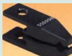
Губки с перпендикулярным креплением