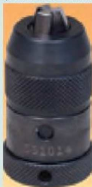
Трёхлапчатый быстрозажимной патрон